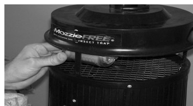
FIGURA 2: POSIZIONAMENTO LURE