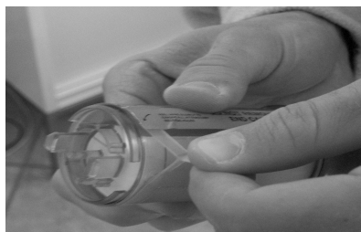
FIGURA 1: RIMOZIONE PELLICOLA LURE PER ZANZARA TIGRE.